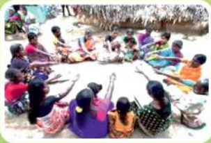
എഫ്.പി.കെ.എസ്സ്/എസ്സ്.എച്ച്.ജി.എസ്സ് സഹകരണ സ്ഥാപനങ്ങൾക്കുള്ള പിന്തുണ