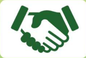
ബ്രാന്റിംഗ് & മാർക്കറ്റിംഗ്