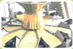
സാങ്കേതിക വിദ്യകളുടെ നവീകരണം