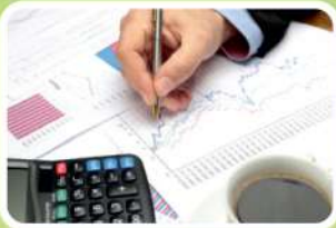
ഡി.പി.ആർ & എഫ്.യു.പി